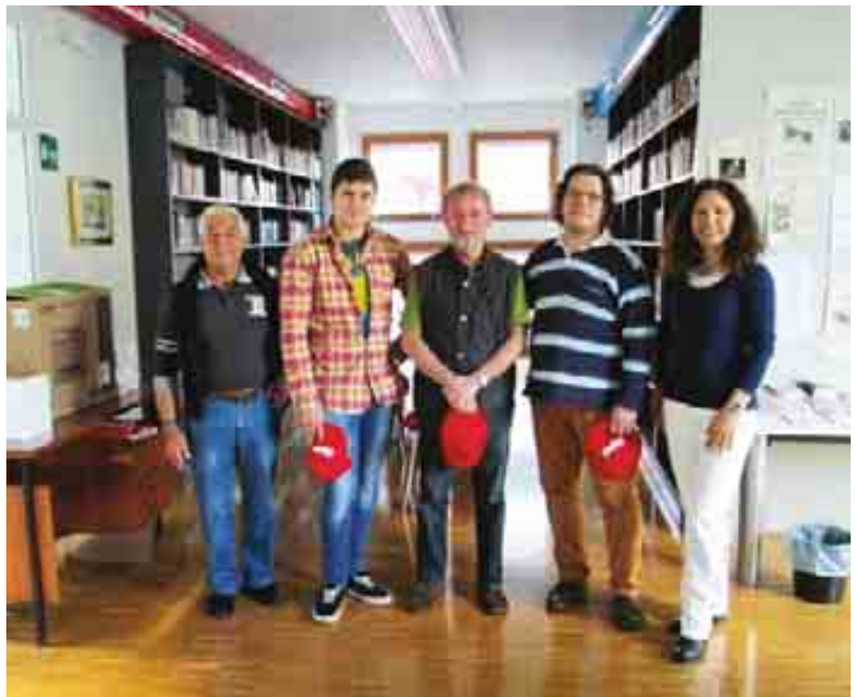
Giuria del 7° Concorso di Pasticceria