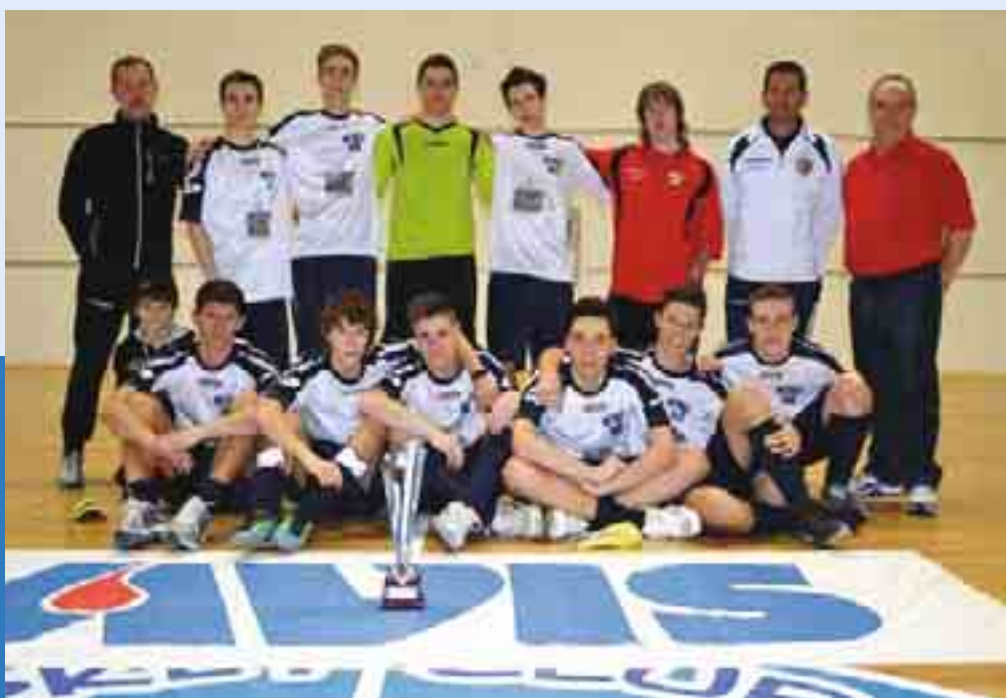
A.S.D. Mattarello vincitrice della 17ª edizione

presso il Palazzetto del Centro Sportivo Trento nord - Gardolo