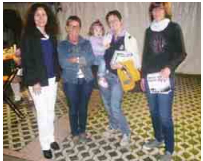
Gruppo dei premiati