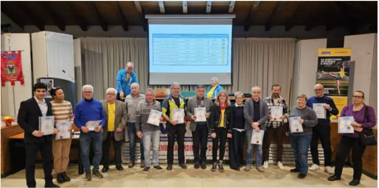
Consegna delle benemerenze.